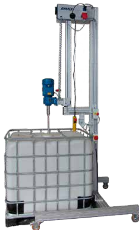
Mobil løsning i aluminium til IBC-tanke.