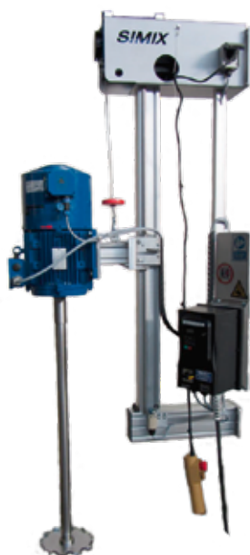
Vægmonteret stativ til betjening af omrører med dissolverskive