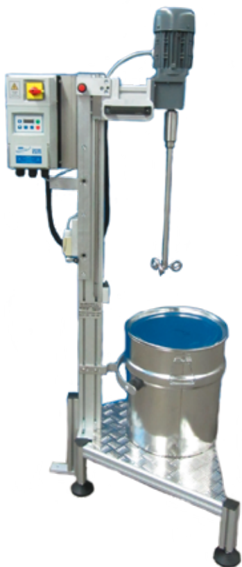
Stationær løsning i aluminium med omrører til maling.

Løfteudstyret kan betjenes manuelt, elektrisk eller pneumatisk.